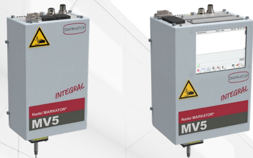
MV5 U65/30 INTEGRAL