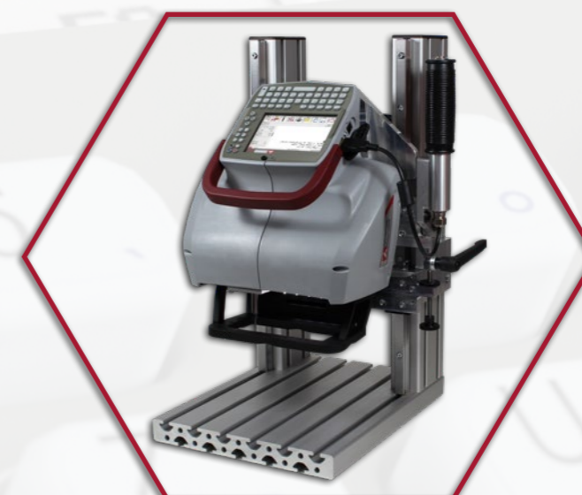
Opcionális jelölőgép állvány a kisalkatrészek jelölésére (FlyMarker® mini 120/45 plus 4,3")