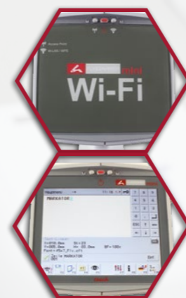
Elérhető smart control wifi kapcsolattal és 5,7"-os érintőképernyővel is