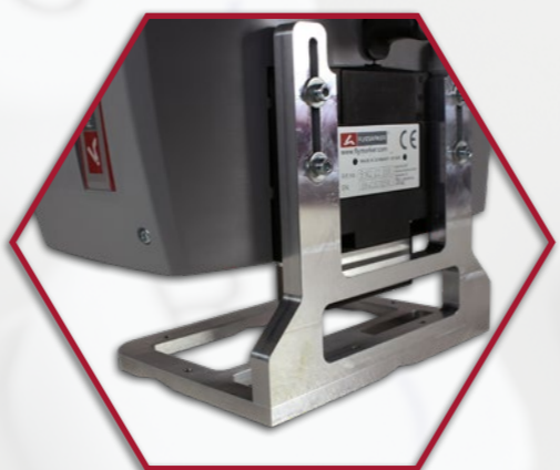
Levehető pozicionáló lemez (opcionális)