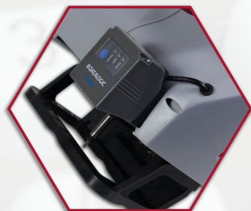
Beépített kódolvasó (opcionális)